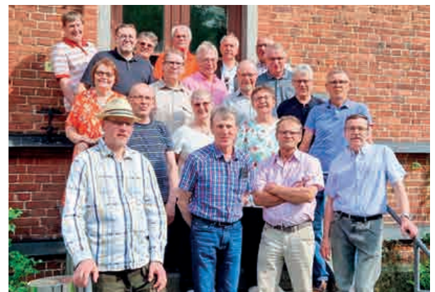
Vuoden 1983 kurssi kokoontui Mustialassa.

Teksti: Antti Vauhkonen