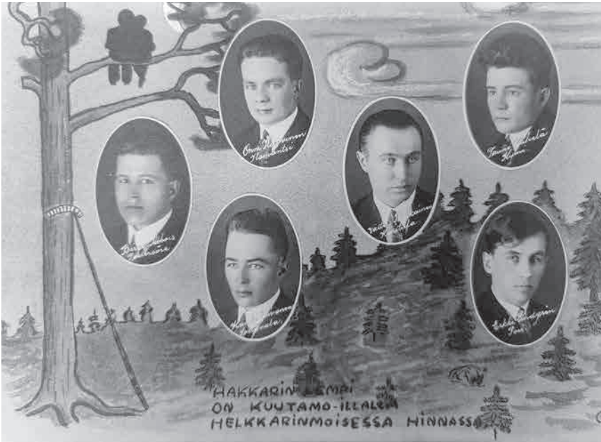
Metossa vaalitaan metsäalan asiantuntijoiden historiaa.