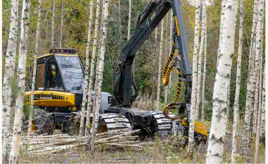
HALUTTUA TAVARAA. Venäjän puuntuonnin loppuminen on merkinnyt erityisesti sitä, että kotimaisella koivukuidulle on riittänyt kysyntää. Myös energiapuuta on korjattu selvästi aiempaa enemmän.

giapuumarkkinoilla. Isossa kuvassa voi sanoa, että tämä iso urakka on pitänyt koneyrityksien työn kysynnän hyvällä tasolla. Myös haketus- ja kuljetusmäärät ovat pysyneet korkealla.