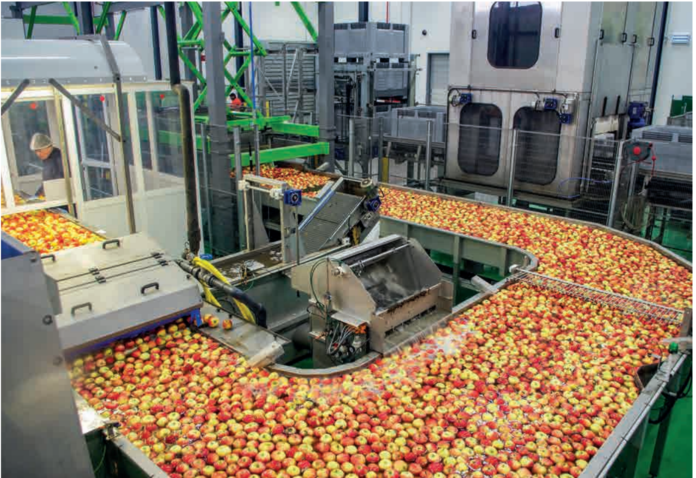
OSUUSKUNTA. Belgialaisen BelOrtan tuoreita hedelmiä myydään noin 75 maassa. Kuvassa omenien lajittelulinjasto.