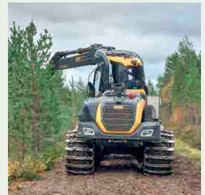
Ennakointi lisää työn sujuvuutta, tehokkuutta ja turvallisuutta.

Lähde: MetsäTurva – Tehokkuutta turvallisuustiedon käyttöön metsäalan pk-yrityksissä. Hankkeen loppuraportti. Työterveyslaitos 2024