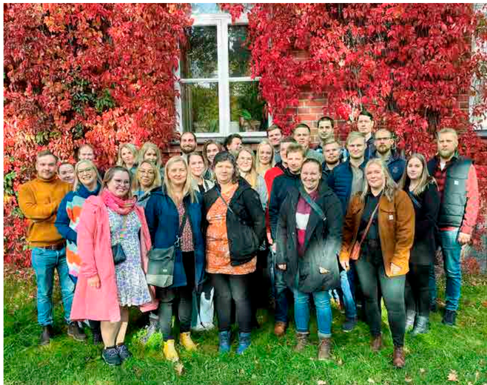
Vuonna 2014 opintonsa aloittaneet olivat runsaslukuisena paikalla.