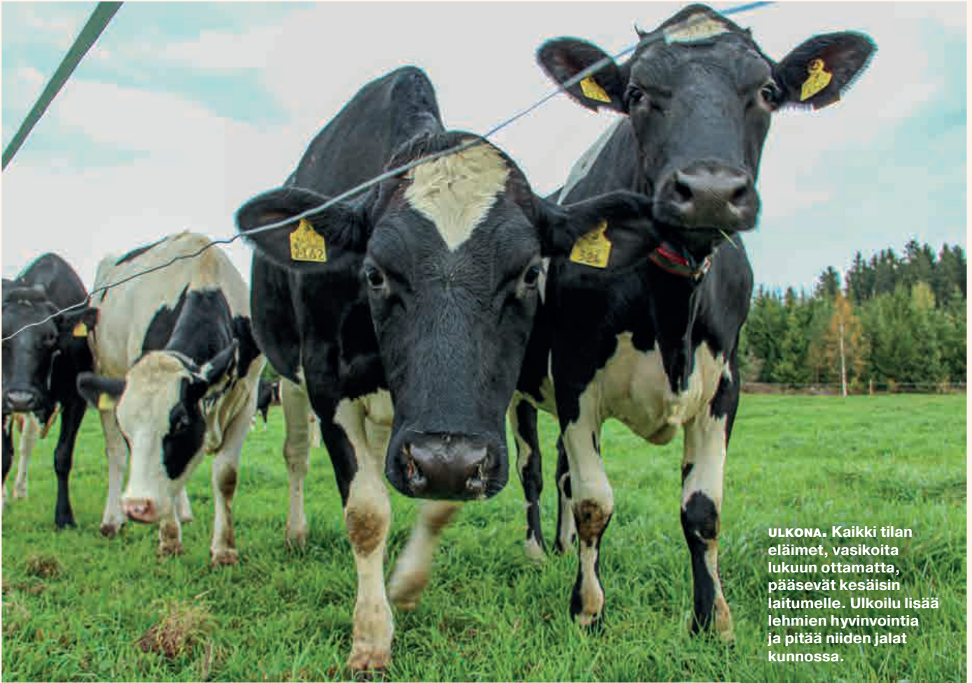
ULKONA. Kaikki tilan eläimet, vasikoita lukuun ottamatta, pääsevät kesäisin laitumelle. Ulkoilu lisää lehmien hyvinvointia ja pitää niiden jalat kunnossa.

Yhteistyön ansiosta naudaneläinten ravinteet saadaan kiertämään myös vilja-tiloille, ja nurmivuodet monipuolistavat niiden viljelykiertoa.