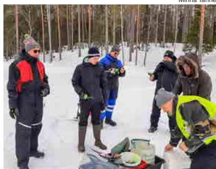
Kainuulaiset ovat kokeilleet vuosikokouksen yhteydessä pilkkimistäkin ammattilaisten opastamina.

uimassa, ajoharjoittelussa, pilkillä sekä ulkoilemassa porukalla.